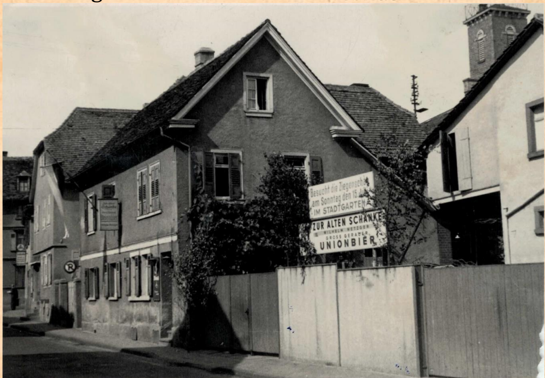
Außenansicht „Alte Schänke“ Fahrgasse 6