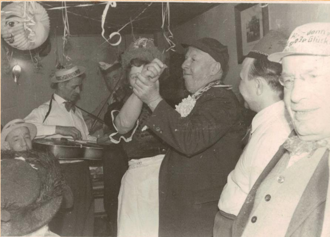
Fastnacht in der „Alten Schänke“

Die Symbole waren z.B. „Wagenrad, Kaltmamsell, Leiterwagen“ usw. Folgendermaßen lautete der Text: „Iss des net e Wagerad, ja des is es Wagerad, is des net e Kaltmamsel, ja des is es Kaltmamsel, ist des net en Leiterwagen, ja des iss en Leiterwagen. Wagerad Kaltmamsell, Leiterwagen ... usw.“